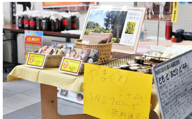
参考：「SDGs マルシェ」実施の様子