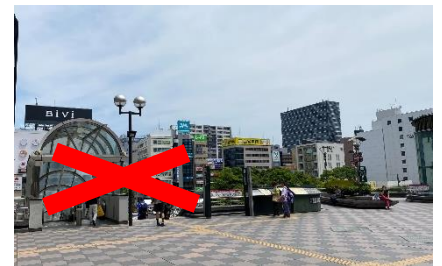
※外へ抜け、左手のエスカレーター・階段は使用しないでください。バス乗り場に繋がっていません。