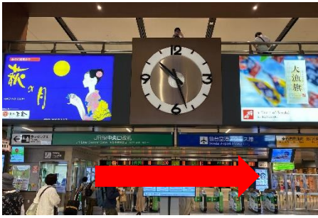
① 2階 JR 線中央口改札（中央に大きな時計があります）を見て右に進みます。