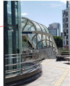
※エレベーターの裏手にエスカレーター・階段があります。

※向かって右端のエレベーター、エスカレーターはシャトルバス乗り場に繋がっていません。