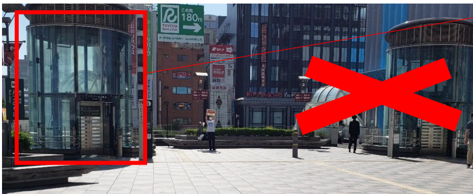
④ 外に抜け、目の前の「観光・送迎・バス乗り場」と示されたエレベーター・エスカレーター・階段より、1階へ降りてください。降り口前が乗車場所になりますので、「尚絅学院大学」と表記してあるバスへご乗車ください。

※向かって右端のエレベーター、エスカレーターはシャトルバス乗り場に繋がっていません。