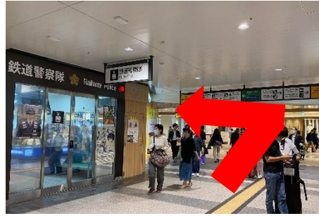
② 直進すると左手に交番がありますので、左に曲がります。