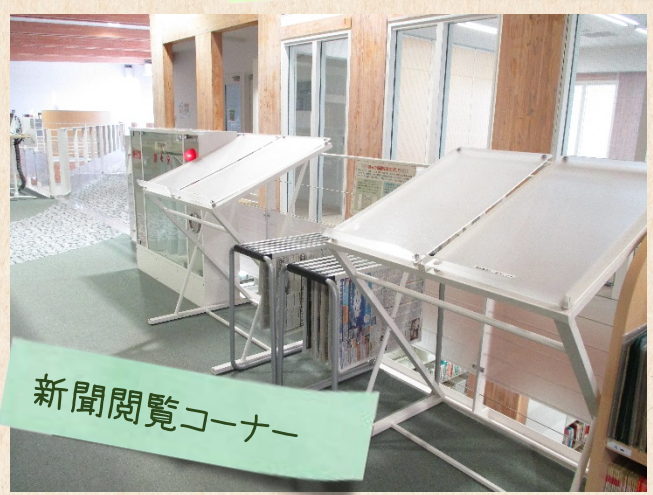
新聞閲覧コーナー

開始日 : 7月14日(土)より 貸出冊数 : 10冊まで(学部生対象) 返却日 : 9月27日(木)