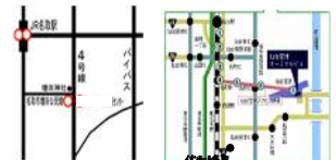
増田地区位置図 仙台空港位置図

今年もピカボードの季節がやってきました。今年で17回目となる光のストリートアート展（PIKANATORI★2016-17）は、中心市街地の活性化とともに、震災からの復興祈願と世界中からの支援への感謝の気持ちを込めて、名取市防災公園前と仙台空港イベント広場の両方の会場で展示いたします。今年の新作は増田小北町地区子供会による「ピカチュウ」と「すみっこぐらし」、尚絅学院大学の学生による「ゴルゴ13」と40年の連載を終えた「こち亀」、そして2016年と2017年のイヤードです。今年の展示も全部が超特大版。夜空に煌めくピカボードの迫力をお楽しみ下さい。制作、展示の費用を名取まちづくり株式会社様にご負担頂きました。ありがとうございます。また、足場の設置は花輪建築設計事務所様、花輪建業様、細井建築設計事務所様です。皆様から感謝です！