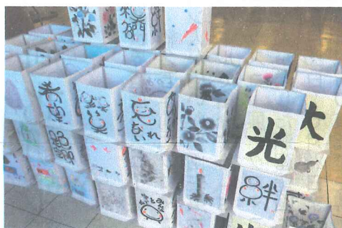
製作途中の絵灯笼