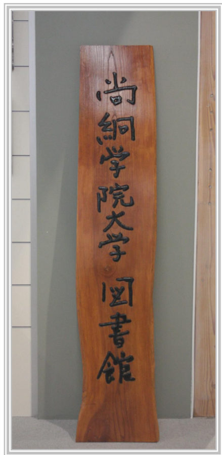
上：図書館1階カウンター向かいの看板

Lib. vol. 2をお届けする。本誌は、尚綱学院大学の学生による団体 Library Mate の広報チームが中心となって制作された広報誌である。Library Mate は2016年度から始まったのだが、私は今年度からの参加にもかかわらず、広報チームリーダーと編集長まで務めてしまって自分でもびっくりしている。締切に追われ大変だったが、なんとか本誌は完成した。文章を書いたり広報物を作ったりしたい、というやる気のある方は来年度参加を求む。(A)